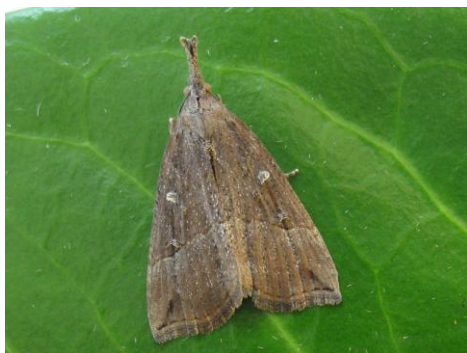
De hopsnuituil werd alleen op smeer gevangen

Opvallend was dat op het smeer op wilg en iep geen nachtvlinders zaten. Op populier zaten er 17 vlinders.