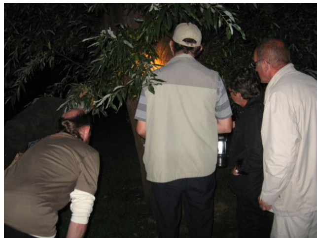
Weinig vlinders op smeer. Zou het aan de wijn liggen?