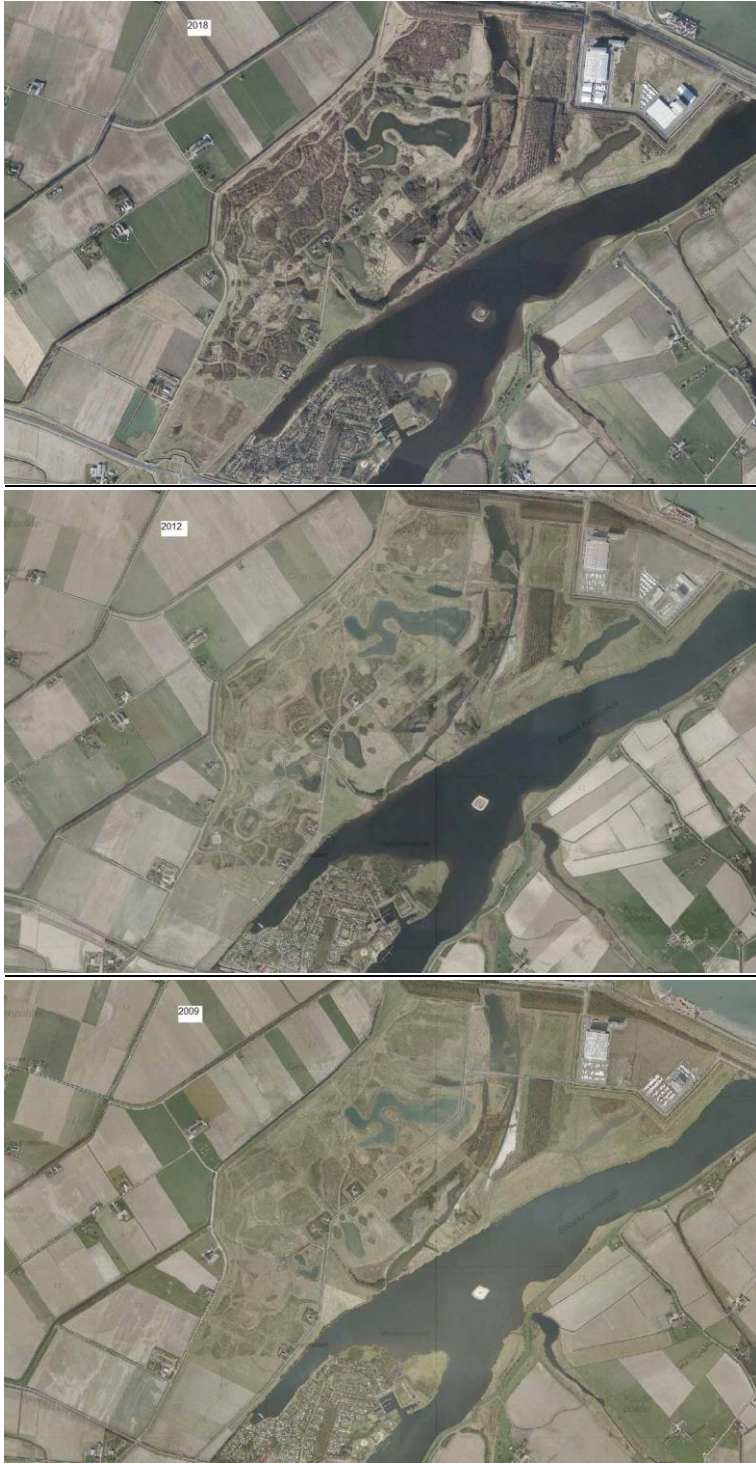
Braakman Noord kaarten en luchtfoto's