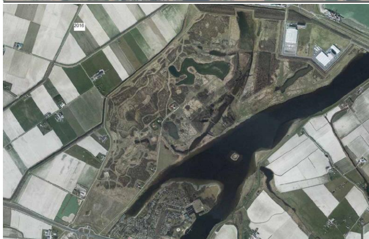
Braakman Noord kaarten en luchtfoto's